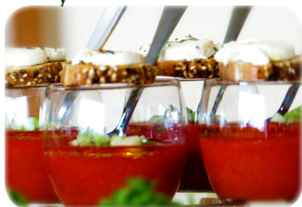
Ensalada italiana, tomates, mozzarella, jamón serrano y calabacines